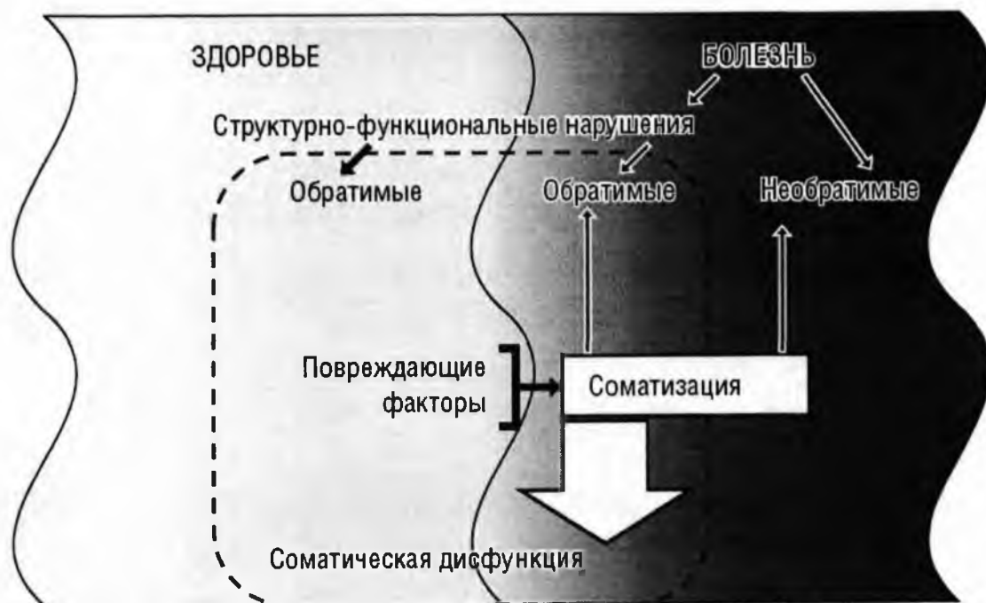
Рисунок 1. Взаимоотношение понятий «здоровье», «болезнь» и «соматическая дисфункция».

В соматической дисфункции можно выделить 3 основных компонента: биомеханический, гидродинамический и нейродинамический. Эти три составляющие объединяют все органы и подсистемы организма в единую целостную систему.