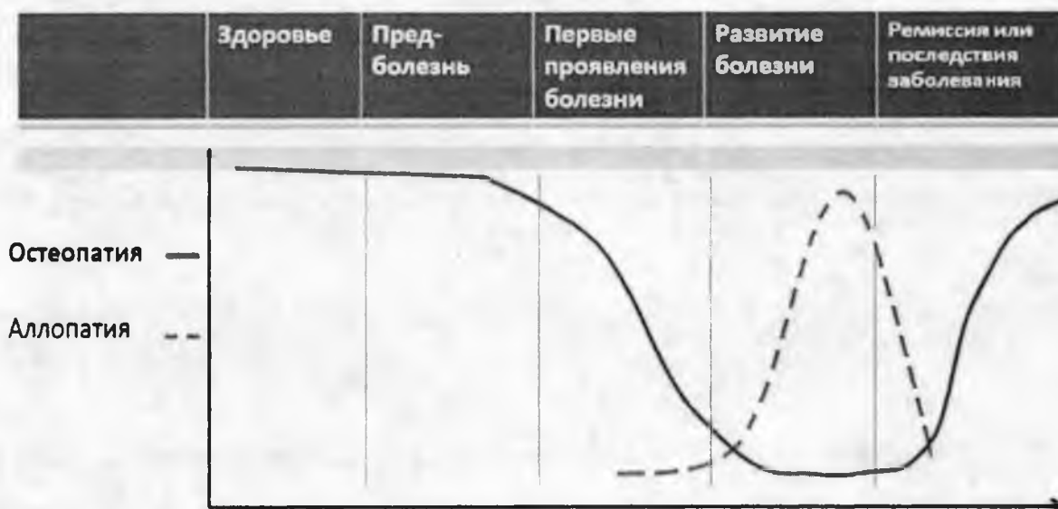
Рисунок 7. Место остеопатии в системе оказания медицинской помощи населению.

ОК может применяться до, совместно или после фармакологического или хирургического лечения и усиливать терапевтический эффект, значительно сокращая при этом период реабилитации пациента и риск возникновения осложнений. Важным результатом ОК является уменьшение лекарственной нагрузки на организм пациента, а, следовательно,