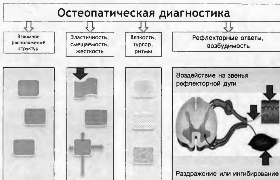
Рисунок 4. Нарушения, выявляемые при остеопатической диагностике

Восстановление подвижности приводит к нормализации функционального состояния тканей и является целью применения остеопатических лечебных техник.